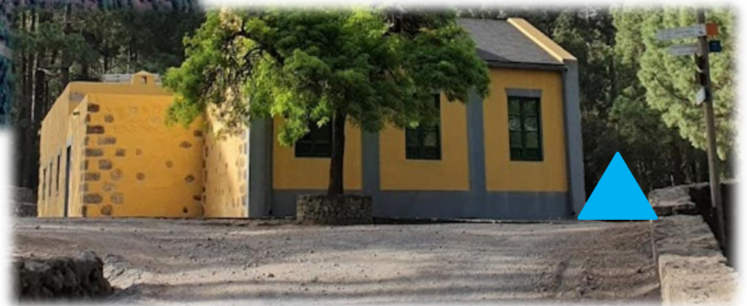
Zona de la carpa