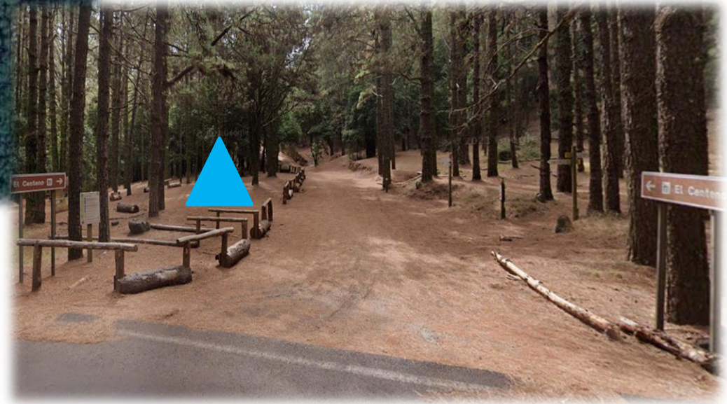
Zona de la carpa