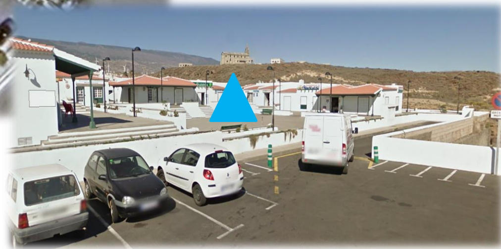
Zona de la carpa